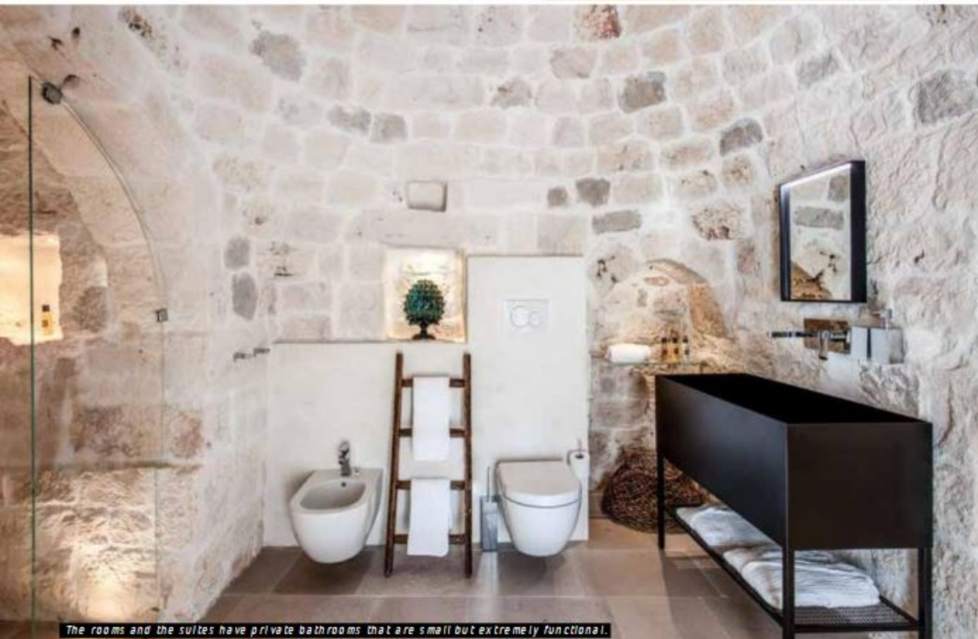
The rooms and the suites have private bathrooms that are small but extremely functional.