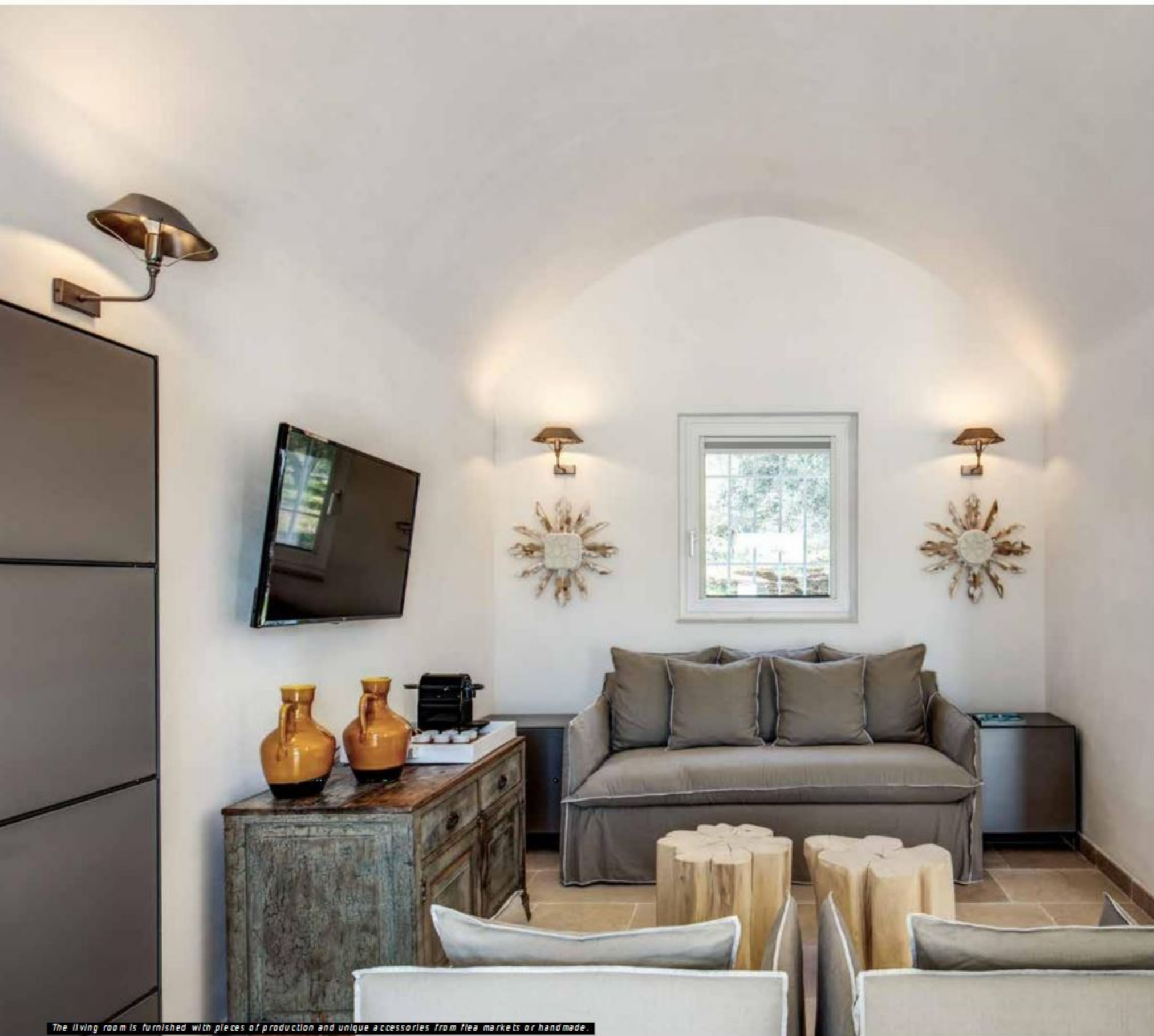
The living room is furnished with pieces of production and unique accessories from flea markets or handmade.