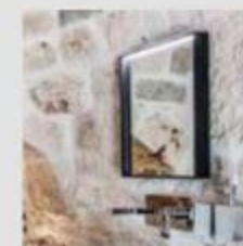
CITTERIO MIRROR Produced by Pozzi Ginori.