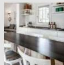
GREY 23 CHAR Produced by Gervasoni. Designed by Paola Navone.