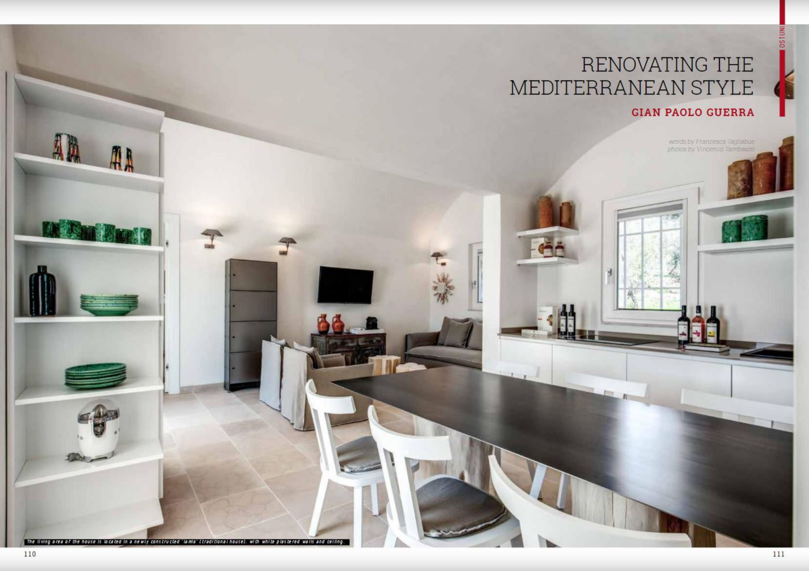
The living area of the house is located in a newly constructed "lamma" (traditional house), with white plastered walls and ceiling.

words by Francesca Tagliabue