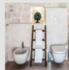
LINK TOILETS Prod. by Ceramica Flaminia. Des. by G. Cappellini, R. Palomba.