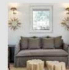
GHOST SOFA Produced by Gervasoni. Designed by Paola Navone.