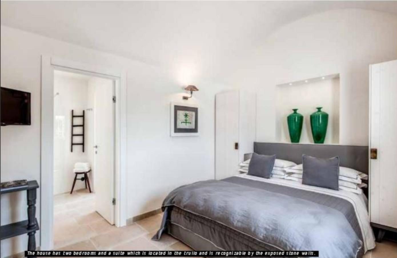
The house has two bedrooms and a suite which is located in the trullo and is recognizable by the exposed stone walls.